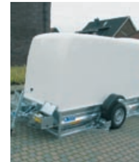
durch das ebenerdige