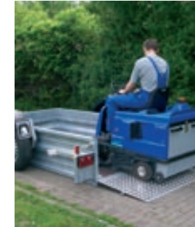
Völlig neue und individuelle