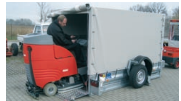
Der Anhänger überzeugt durch einfaches Handling. Die Ladefläche wird hydraulisch über eine manuelle Pumpe auf- und abgelassen.